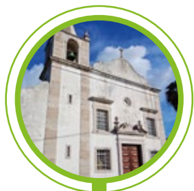
IGREJA DE SÃO JULIÃO E SANTA BASILISA, FRIELAS