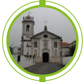
IGREJA MATRIZ DE SANTO ANTÃO DO TOJAL