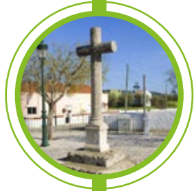
LARGO DA LIBERDADE