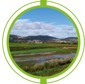
VÁRZEA DE LOURES