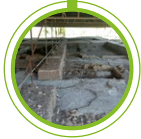
ESTAÇÃO ARQUEOLÓGICA DE FRIELAS