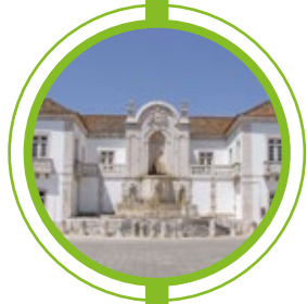
CONJUNTO MONUMENTAL DE SANTO ANTÃO DO TOJAL